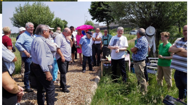
Bezoek aan vlinderstichting tijdens Jumulage